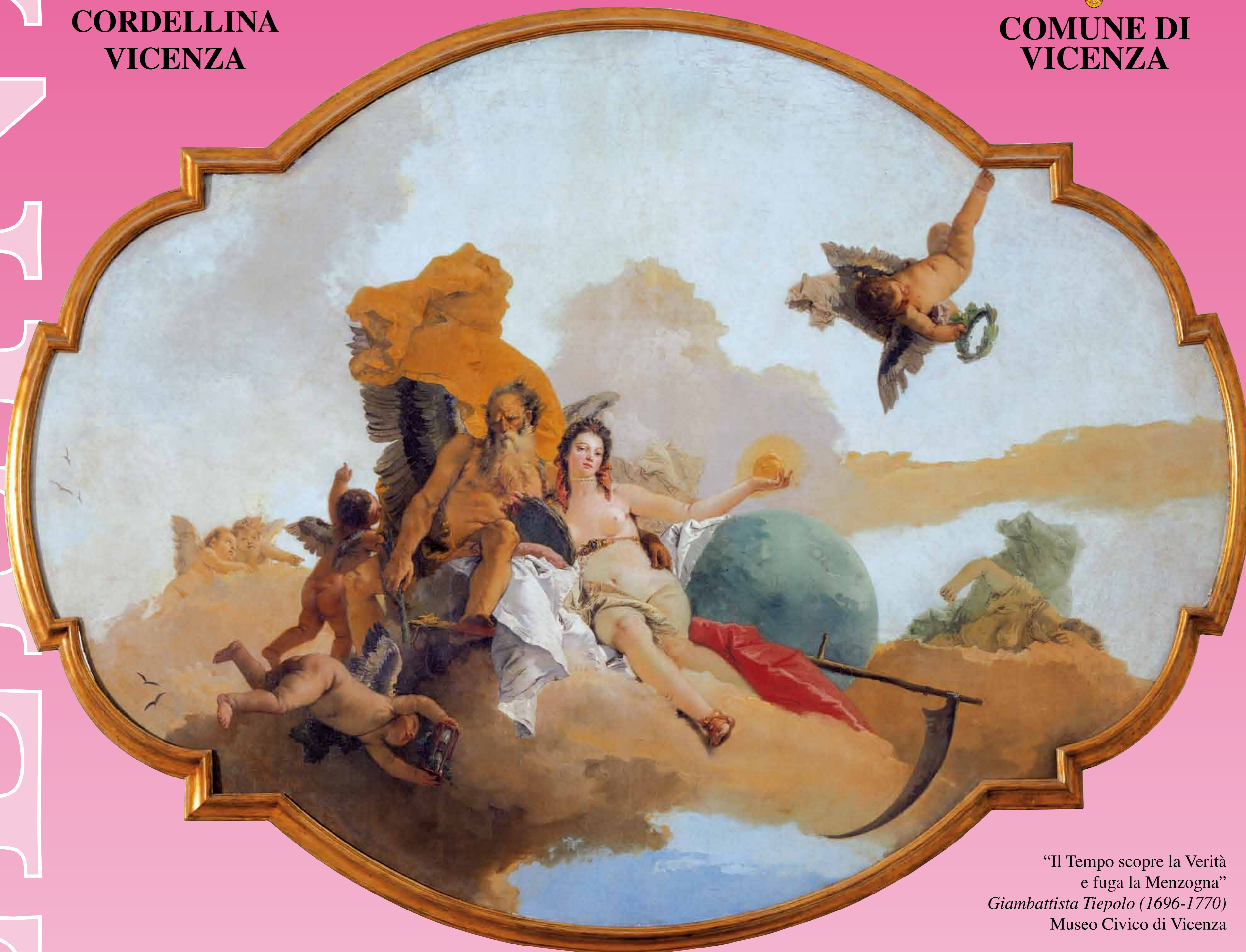
"Il Tempo scopre la Verità e fuga la Menzogna" Giambattista Tiepolo (1696-1770) Museo Civico di Vicenza